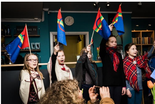
Satsing på samiske kulturfag.