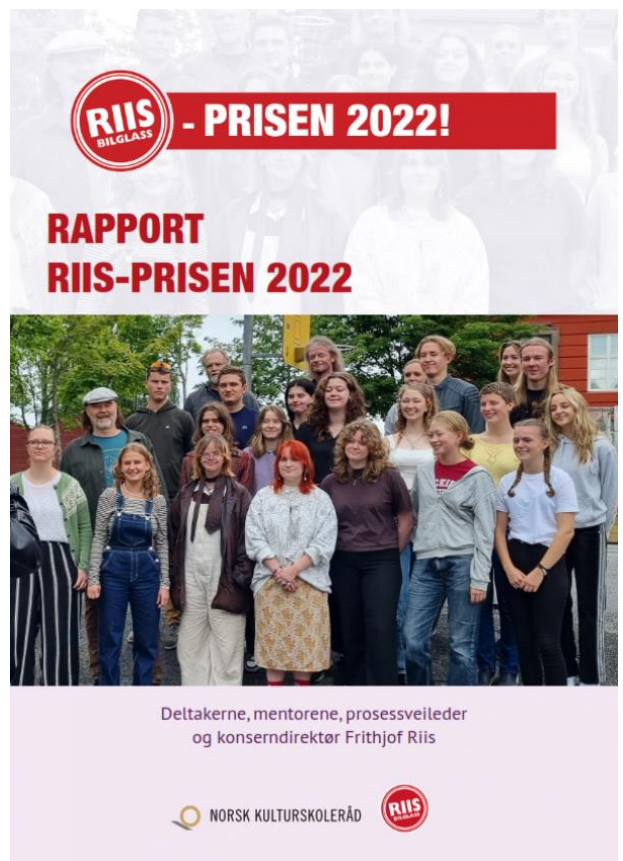
Rapport om RIIS - prisen